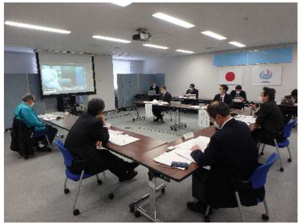
令和2年度 北陸地域港湾の事業継続計画協議会の状況