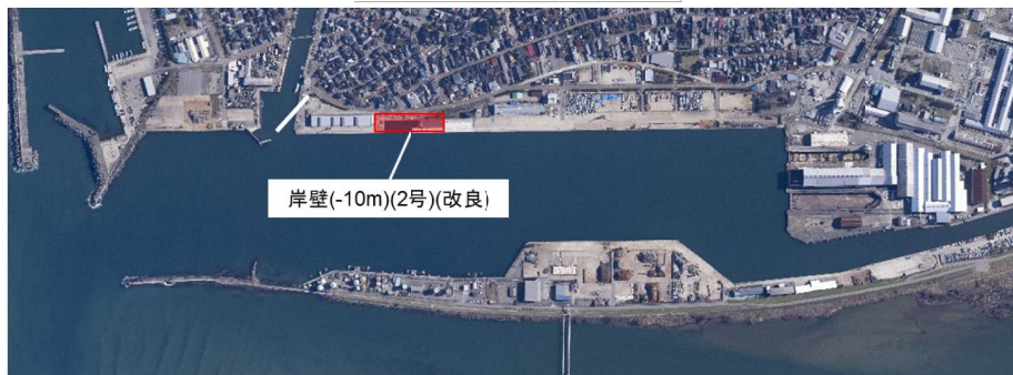
伏木富山港(富山地区)