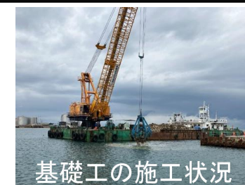
基礎工の施工状況

・基礎捨石を安定的に確保するため、追加で調達先の代替地を確保し、運搬・投入の施工方法を変更。 ・当初想定 of 浚渫船が他工事に従事しており代替船に変更。