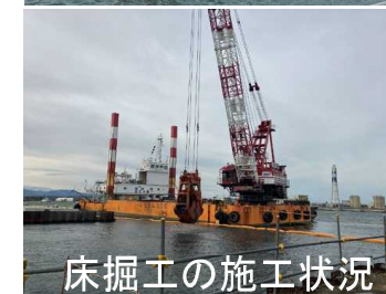
床掘工の施工状況