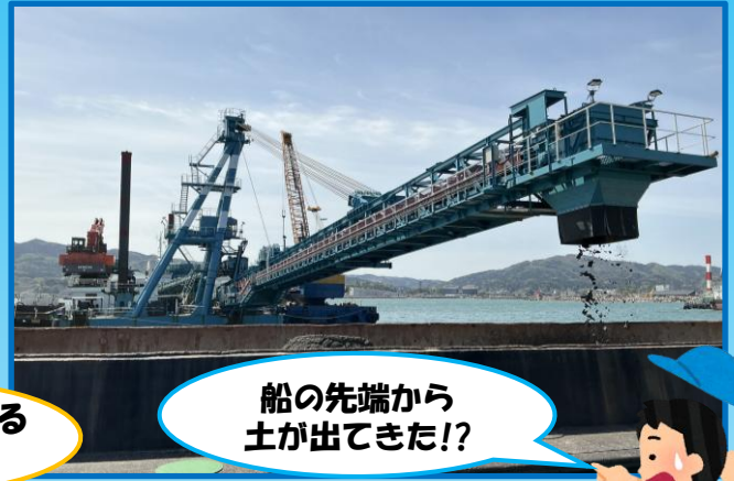
船の先端から 土が出てきた！

大きな船が港を利用できるようにするため、 地震で隆起した海底を掘り下げる工事を行っています。 めったに見られない作業船の中を見学しませんか？