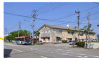
新潟交通(株)入船営業所