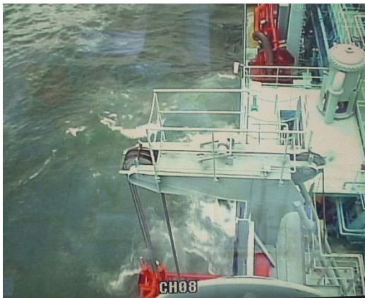
流出油回収作業状況（近景）