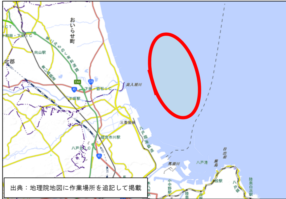
「白山」防除作業範囲