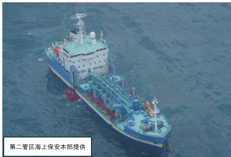
流出油回収作業状況（全景）