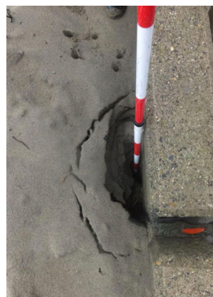
点検時写真・小規模な陥没箇所の発見