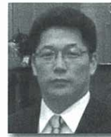
しん ぎゅほ 陳 奎昊氏 釜山港湾公社 日本代表部代表

1946年射水市生まれ。明治大学政経学部卒業。会社員生活を経て1982年から新湊市市議員を経て1982年から新湊市市議員を5期、1999年より新湊市長を2期務める。2005年11月に初代の射水市長に就任。