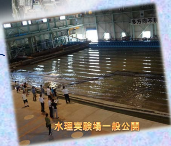
水理実験場一般公開

◆動きやすい服装、かかとの低い履物で、また船酔いをご心配な方は薬の用意を願います（ハイヒール、サンダルでの乗船はご遠慮願います。）。