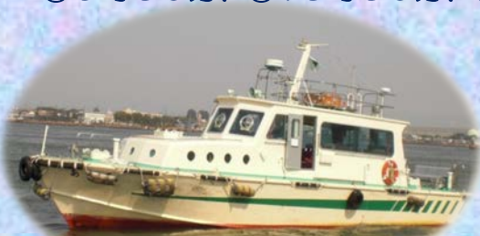
港湾業務艇「あさひ」乗船