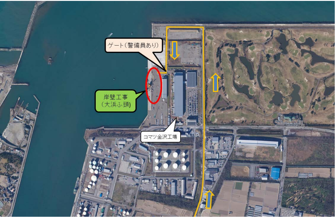
○消波ブロック製作工事（金石大野埋立用地）