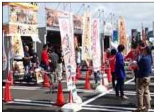
「みなとオアシス」における地域振興イベント