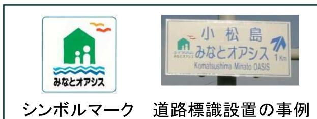
シンボルマーク 道路標識設置の事例