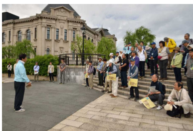
新潟市歴史博物館脇で主催者挨拶

博物館本館2階セミナー室で講義を受講した後、「信濃川左岸緑地（みなと・さがん）」・「柳都大橋」を経て、朱鷺メッセ展望室を目指しました。