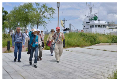
信濃川沿いをウォーク