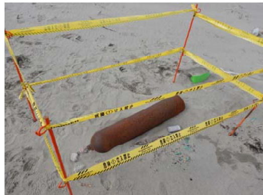
海岸漂着物発見後、立ち入り禁止措置を実施