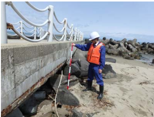
異常吸出し箇所の有無を調査