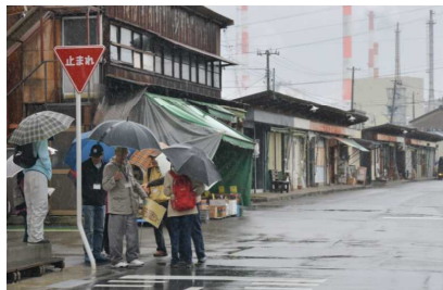
沼垂テラス商店街