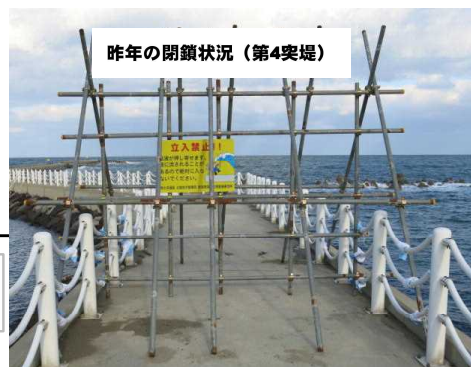
昨年の閉鎖状況(第4突堤)